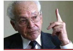
ORLANDO FALS BORDA 1925-2008